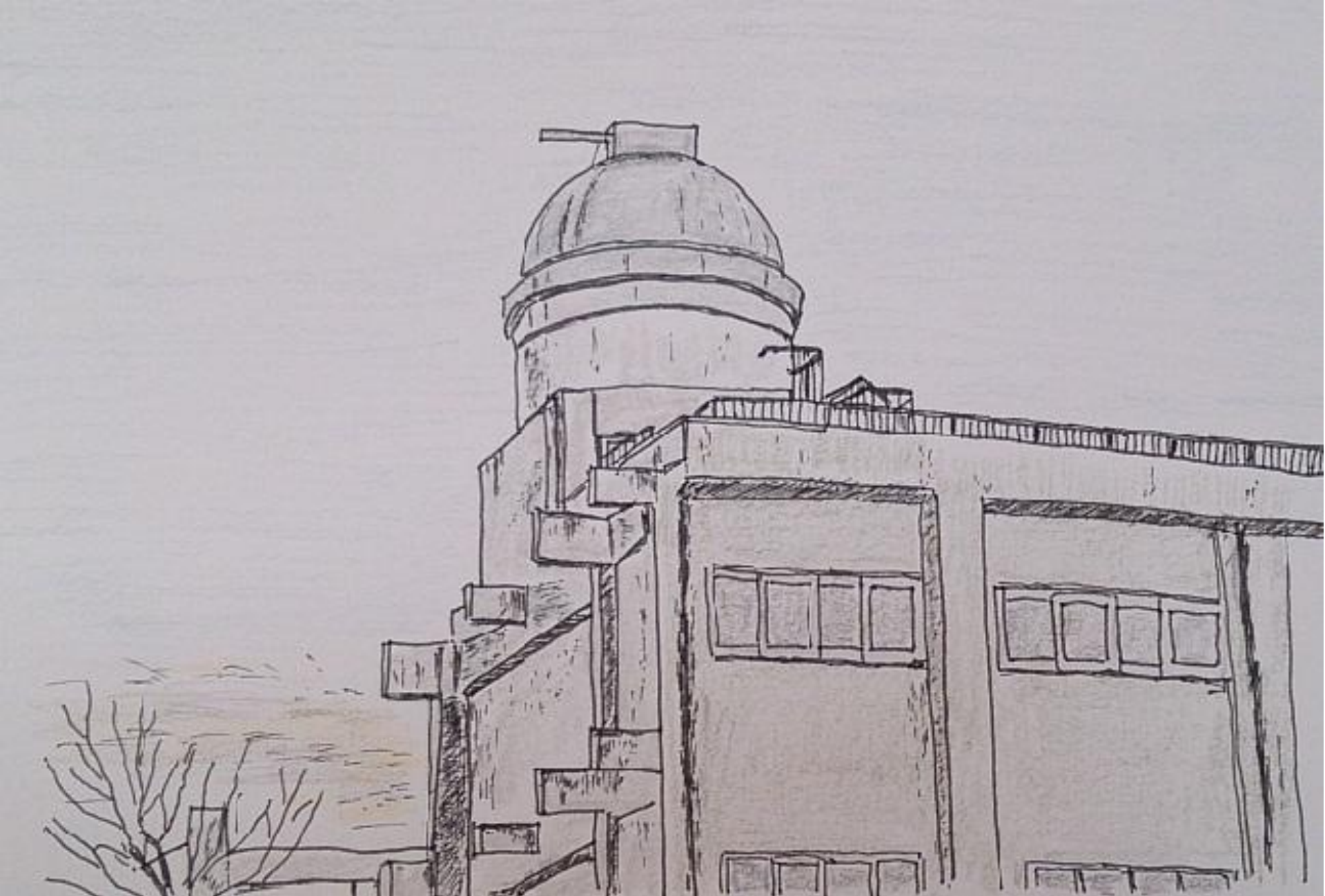
県立加茂高校天文観測ドーム(夏休みは天体観察で賑わいます)