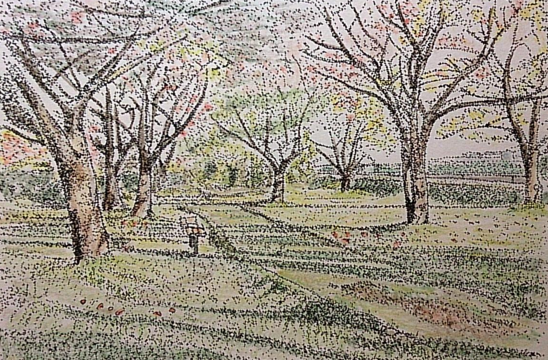
石川公園（落葉した桜が朝日をあびています）